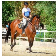
r i d e a h o r s e