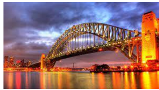
B r i d g e