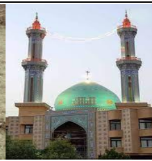
m o s q u e