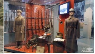
m u s e u m

متن زیر را با استفاده از کلمات داده شده کامل کنید. (یک کلمه اضافه است.)