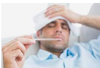
f e v e r