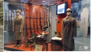
m - s - - m

متن زیر را با استفاده از کلمات داده شده کامل کنید. (یک کلمه اضافه است.)