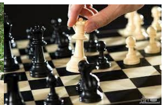
C h e s s