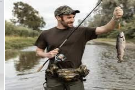
f - s - ing