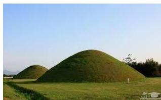
h i l l

listening to the radio/ride a horse/ chess/ sore throat/ hill/ village/ stadium/fever/ cow