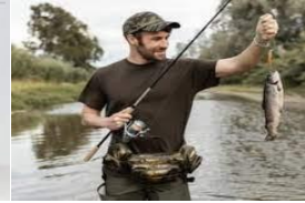
f i s h i n g