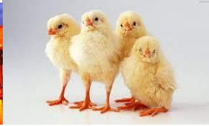
ch i c k e n