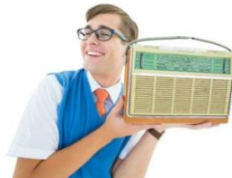
l i s t e n i n g t o t h e r a d i o