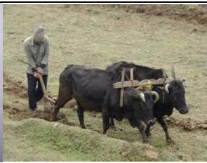
p l o w