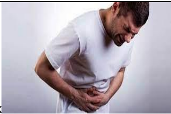
sto m a c h a c h e