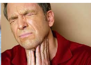
s o r e t h r o a t