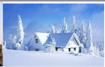
w i n t e r