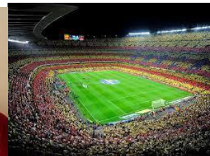
s t a d i u m