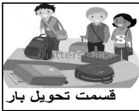
قسمت تحویل بار

با توجه به تصاویر، با نوشتن کلمه های مناسب، مکالمه ها را کامل کنید.